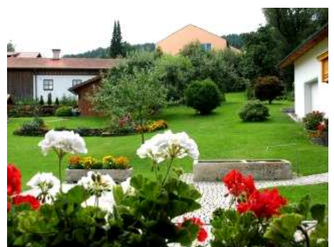
Ausblick Schlafzimmer 07 in den Garten