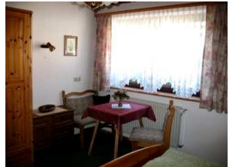
Sitzgruppe im Schlafzimmer 07