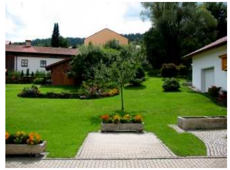
Ausblick Garten FeWo

Hunde in der Whg.: Jede Größe, vorzugsweise ohne langes Fell. Bei Urlaub mit Hund gehört zur FeWo ein eigener Gartenanteil (komplett eingezäunt). Wissenswertes Informationen zu „ Bayerwaldurlaub mit Hund “ sowie Hundeaufenthalt in unserem Gästehaus erhalten Sie unter www.Angebot-Urlaub-mit-Hund.de