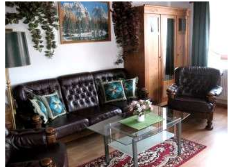
Wohnzimmer mit ca. 21 m 2 .