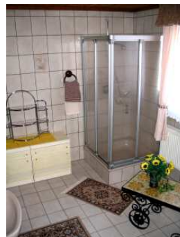
Dusche von Schlafzimmer 06