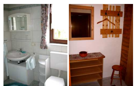
Bad 07 mit Dusche & WC Kl. Diele zwischen Bad & SZi.