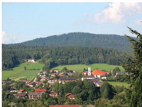
Ausblick Schlafzimmer 06 in das Regental