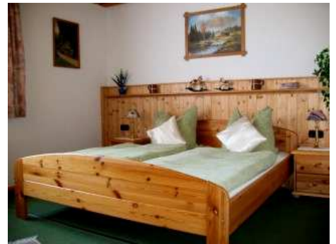
Doppelbett Schlafzimmer 07