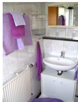
mit Dusche und WC