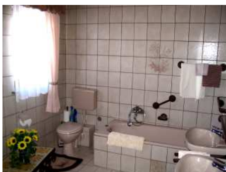
Bad von Schlafzimmer 06 mit Dusche + Wanne, 2 Waschbecken & WC