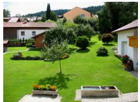
Ausblick zusätzl. Schlafzimmer in den Garten