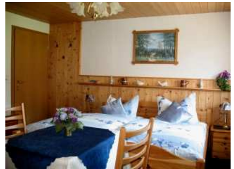
Sitzgruppe im zusätzl. Schlafzimmer

FeWo-Kombi : Bei Belegung der FeWo mit 3-4 Personen kann ein separates Doppelzimmer mit Dusche und WC (NR-Zi.) im OG für ältere Kinder, Verwandte, Bekannte oder Freunde bei zeitgleicher Aufenthaltsdauer zugebucht werden. Maximalbelegung FeWo-Kombi (inkl. zusätzl. Doppelzimmer): 8 Personen.