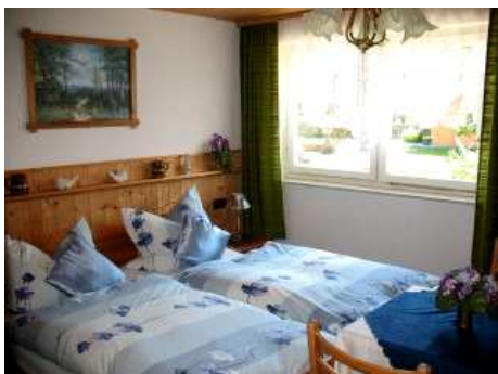
Zusätzl. Doppelschlafzimmer (FeWo-Kombi):