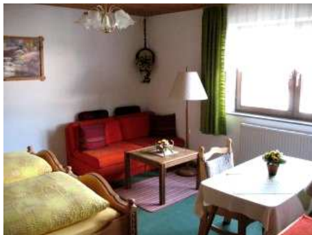
Sitzgruppe + (Schlaf-)Couch im Schlafzi. 06