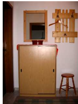
Kleine Diele zwischen Bad und Schlafzimmer 06