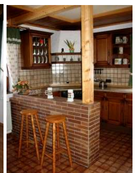
Essbereich Wohnzimmer - Wohnküche mit EBK