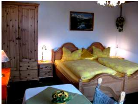
Doppelbett Schlafzimmer 06