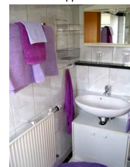
mit Dusche & WC