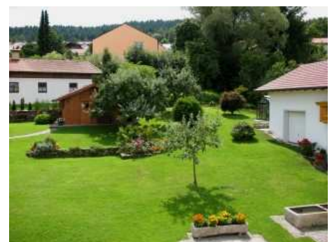
Blick in den Garten (WoKü, 2. Schlafzimmer)