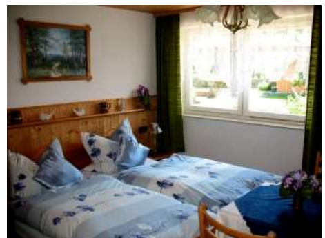
Zusätzl. Doppelschlafzimmer (FeWo-Kombi)