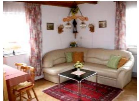
Wohnküche mit ca. 19 m 2 .