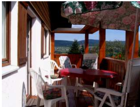
ca. 9 x 2 m Süd-Ost Balkon