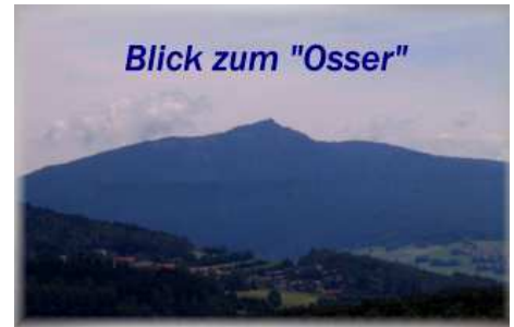
Blick zum "Osser"

Aktuelle Bilder der Einrichtung können ggf. vom Grundriss abweichen.